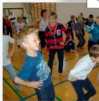
VESTERMOSE IF VE VESTSJÆLLANDS SØNDERUP, NORDRU