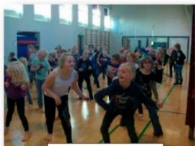
SÅ ER DER ZUMBA